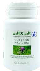
Boîte de 60 gélules (origine végétale)

Conseils d'utilisation : Prendre 2 à 3 gélules par jour, à avaler avec un grand verre d'eau, le matin de préférence. Ingrédients: Extrait de parties aériennes de chardon marie* ( Silybum marianum - maltodextrine*) dosé en silymarine, gélule d'origine végétale : hydroxypropylméthylcellulose, agent de charge : gomme d'acacia*.