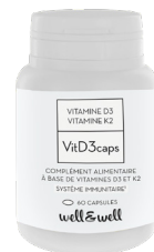
Boîte de 60 capsules (origine poisson)

DJ : Dose Journalière | AR : Apports Recommandés