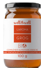
Flacon de 100g

*Ingrédients issus de l'agriculture biologique.