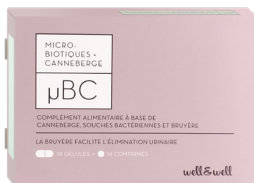
Boîte de 14 gélules (origine marine) + 14 comprimés