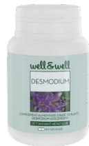
Boîte de 60 gélules (origine végétale)

Le desmodium est une plante qui aide à protéger et régénérer les cellules du foie. Elle est connue pour son efficacité en cas d'agression du foie par des agents extérieurs ( alcoolisme, hépatites virales , prise de médicament au long cours comme la pilule contraceptive...)