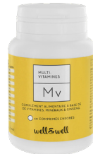
Boîte de 60 comprimés enrobés

Ingrédients : Agents de charge : cellulose microcristalline - phosphate dicalcique, oxyde de magnésium d'origine marine, extrait de racines de ginseng ( Panax ginseng - maltodextrine), agents d'enrobage: hydroxypropylméthylcellulose - hydroxypropylcellulose - acides gras - amidon, acide ascorbique (vitamine C), antiagglomérants : sels de magnésium d'acides gras- talc, pidolate de zinc, nicotinamide (vitamine B3), acétate de D-alpha-tocophéryle (vitamine E), levure enrichie en sélénium, pantothénate de calcium (vitamine B5), colorants: carmines - riboflavines, acétate de rétinyle (vitamine A), cholécalfiérol (vitamine D), sulfate de manganèse, chlorhydrate de pyridoxine (vitamine B6), riboflavine (vitamine B2), chlorhydrate de thiamine (vitamine B1), acide folique (vitamine B9), biotine (vitamine B8), méthylcobalamine (vitamine B12).