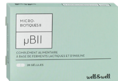
Boîte de 28 gélules (origine marine)

Ingrédients : Inuline de chicorée (360mg), Maltodextrine, Enveloppe de la gélule : gélatine (poisson), Mélange de ferments lactiques (soja): Lactobacillus plantarum (12 milliards UFC*), Lactobacillus rhamnosus GG (8 milliards UFC), Bifidobacterium longum (8 milliards UFC), Bifidobacterium breve (8 milliards UFC), Lactobacillus acidophilus (4 milliards UFC), Antiagglomérants : fibre de riz et sels de magnésium d'acides gras.