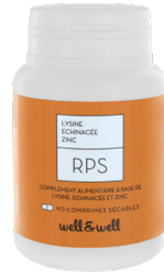
Boîte de 90 comprimés sécables

Le zinc contribue au fonctionnement normal du système immunitaire. L' Echinacea Purpurea renforce les défenses naturelles de l'organisme.