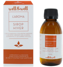
Flacon de 125ml

*Ingrédients issus de l'agriculture biologique. Alcool 2.6 % vol.