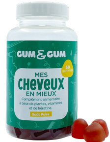
Boîte de 60 gummies

Le zinc contribue au maintien de cheveux et d'ongles normaux.