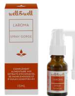
Spray de 15ml

Ingrédients : Sirop d'agave ; eau, stabilisant : glycérine, alcool ; extrait de racine d'échinacée ( Echinacea purpurea ) ; extrait de pépin de pamplemousse ( Citrus x paradisi ) ; huiles essentielles d'orange douce, de citron, d'eucalyptus radiata, de romarin à cinéole, de menthe arvensis, épaississant : gomme de xanthane ; huile essentielle d'origan compact. Alcool 9,6% vol