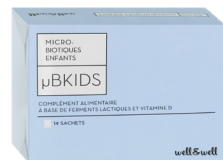
Boîte de 14 sachets

Ingrédients : Maltodextrine, Mélange de ferments lactiques (lait, soja) [Lactobacillus rhamnosus GG (1,4 milliards UFC*), Lactobacillus acidophilus (1,4 milliards UFC), Bifidobacterium animalis lactis (0,8 milliard UFC), Bifidobacterium bifidum (0,4 milliard UFC)], Bifidobacterium infantis (1milliard UFC), Cholécalférol (VitD3 : 0,75 \mu g = 15% des Apports de Référence).