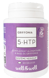
Boîte de 60 gélules (origine végétale)