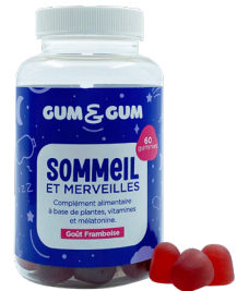
Boîte de 60 gummies

Ingrédients : Sirop de glucose ; sucre ; agent gélifiant: pectine ; extrait de fleurs de passiflore ; acidifiant : acide citrique; extrait de capitules de camomille allemande ; extrait de feuilles de mélisse ; acidifiant: citrate trisodique; huile de noix de coco ; colorant: anthocyanes ; arôme naturel ; chlorhydrate de pyridoxine (vitamine B6) ; mélatonine ; agent d'enrobage : cire de carnauba. Origine des actifs : UE/ non UE.