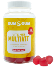
Boîte de 60 gummies