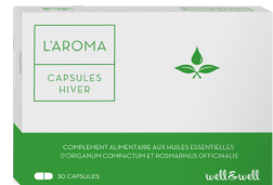
30 capsules (origine marine)

*Ingrédients issus de l'agriculture biologique.