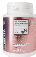
Boîte de 90 gélules (origine végétale)

Conseils d'utilisation : Prendre 3 gélules par jour, avec un grand verre d'eau, au moment du petit-déjeuner.