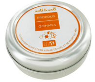
Boîte de 45g