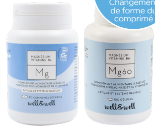
Boîte de 90 & boîte de 180 comprimés sécables