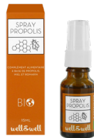
Spray de 15ml

*Ingrédients issus de l'agriculture biologique