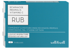
Boîte de 15 gélules

Ingrédients : Extrait de parties aériennes d'échinacée pourpre ( Echinacea purpurea ) 240mg (support : maltodextrine), gélule d'origine végétale : hydroxypropylmethylcellulose, extrait de feuilles de thym ( Thymus vulgaris ) 120mg (support : maltodextrine), poudre de miel 120mg, extrait de parties aériennes d'andrographis ( Andrographis paniculata ) 90mg, vitamine C (acide ascorbique) 80mg = 100% VNR*, agent de charge : maltodextrine, antiagglomérant : sels de magnésium d'acides gras, extrait de propolis (support : maltodextrine) 15mg, fibres de riz, citrate de cuivre (Cuivre) 1mg = 100% VNR*, arôme : huile essentielle de feuilles d'eucalyptus globuleux ( Eucalyptus globulus ).