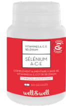
Boîte de 60 gélules

Ingrédients : (Quantités pour une gélule) : Jus concentré d'Acérola dosé en vitamine C ( Malpighia glabra ) 240mg, acide ascorbique (vitamine C) 60mg, gélule: hydroxypropylméthylcellulose (tunique végétale), bêta-carotène naturel à 10 % ( Dunaliella salina ) 28mg (vitamine A), levure au sélénium 25mg, alpha-tocophérol acétate synthétique (vitamine E) 24mg, maltodextrine, stéarate de magnésium (anti-agglomérant).