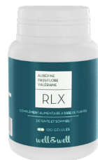
Boîte de 120 gélules (origine végétale)

La passiflore est reconnue pour ses vertus tranquillisantes, pour calmer les états anxieux, les troubles du sommeil et le stress.