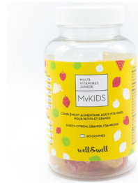
Boîte de 60 gommes

Ingrédients : Agent de charge : cellulose, Acidifiant : Phosphate dicalcique, Magnésium marin, Extrait de ginseng ( Panax Ginseng ), Acide ascorbique (vitamine C), Pelliculage orange (Epaississants : E464 et E463, Antiagglomérants : E460, E570 et E553b, Colorants: E171, E120 et E101), Pidolate de zinc, Pidolate de fer, Antiagglomérant : stéarate de magnésium, Nicotinamide (vitamine B3), Acétate de D alphanatocéphérol (vitamine E), Antiagglomérant : silice colloïdale, Levure de sélénium, Panthothénate de calcium (vitamine B5), Cyanocobalamine (vitamine B12), Acétate de rétinol (vitamine A), Cholécalfiférol (vitamine D), Sulfate de manganèse, Chlorhydrate de pyridoxine (vitamine B6), Riboflavine (vitamine B2), Chlorhydrate de thiamine (vitamine B1), Acide ptéroylmonoglutamique (vitamine B9), Biotine (vitamine B8).