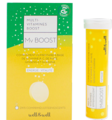
2 boîtes de 15 comprimés effervescents

Le maté est une boisson traditionnelle Sud-Américaine préparée en infusant des feuilles de yerba maté, plante réputée comme stimulant quotidien et permettant d'améliorer la réactivité et les capacités de concentration (notamment dus à la caféine qu'elle contient).