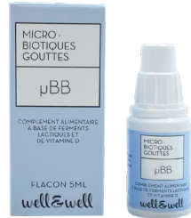
Flacon de 5mL

Ingrédients : Huile de tournesol, triglycérides à chaînes moyenne (issus du coprah), émulsifiant : lécithine de colza, ferments lactiques ( Lactobacillus rhamnosus , Bifidobacterium animalis lactis , Lactobacillus reuteri ), acétate de DL-alpha-tocophéryle, cholécalfcérol (vitamine D).