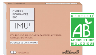
Boîte de 30 gélules (origine végétale)

Ingrédients : Poudre de Cyprès* ( Cupressus sempervirens L., Noix), Extrait d'Echinacée pourpre* ( Echinacea purpurea L., parties aériennes), Enveloppe d'origine végétale : hydroxypropylméthylcellulose, Maltodextrine*, Antiagglomérant : silicate de magnésium (talc). *Produits issus de l'Agriculture Biologique.