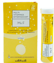
2 boîtes de 15 comprimés effervescents

Ingrédients : Acidifiant : acide citrique ; correcteur d'acidité : bicarbonate de sodium ; édulcorant : sorbitol ; carbonate de calcium ; carbonate de magnésium ; vitamine C ; arôme naturel d'orange ; anti-agglomérant : polyéthylène glycol ; vitamines A, B1, B2, B3, B5, B6, B8, B9, B12, D3, E ; colorant : rouge betterave ; sulfate de zinc ; édulcorants : sucralose, saccharinate de sodium, acésulfame de potassium ; gluconate de manganèse, chlorure de chrome trivalent ; sélénite de sodium