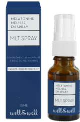
Flacon de 15ml

Ingrédients : Glycérine, eau, extrait sec de mélisse, arôme verveine, mélatonine, conservateurs : sorbate de potassium et benzoate de sodium, acidifiant : acide citrique.