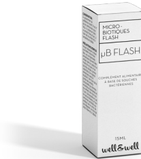
Boîte de 4 sticks

Ingrédients : Maltodextrine, FOS (Fructo-oligosaccharides), Mélange de ferments lactiques : Lactobacillus plantarum (4 milliards UFC*), Lactobacillus rhamnosus GG (12 milliards UFC), Bifidobacterium longum (12 milliards UFC), Lactobacillus acidophilus (12 milliards UFC), Acide citrique anhydre, Arôme poudre (orange), Stevia Rebaudiana.