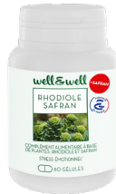
Boîte de 60 gélules (origine végétale)

Ingrédients : Extrait de Rhodiole ( Rhodiola rosea , racine, origine Chine), Agent de charge : carbonate de magnésium, Enveloppe d'origine végétale : Hydroxypropylméthylcellulose, Extrait de Safran ( Crocus sativus , stigmate), Antiagglomérant: sels de magnésium d'acides gras, Huile de tournesol bio.