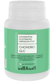
Boîte de 80 comprimés sécables

L' harpagophytum (ou griffe du diable) est une plante connue pour ses propriétés anti-inflammatoire et analgésique. Elle aiderait à améliorer la mobilité des articulations.