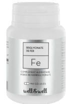
Boîte de 90 gélules (origine végétale)