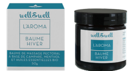
Pot de 50g

*Ingrédients issus de l'Agriculture Biologique