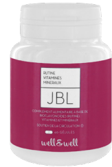
Boîte de 60 gélules (origine végétale)

Les radicaux libres , résultats de la respiration, de l'oxydation, du vieillissement de nos cellules, sont véhiculés dans la circulation sanguine. Ils sont responsables de la lourdeur des jambes, d'œdèmes éventuels, et d'altération de la microcirculation. La rutine et les vitamines C et E sont des anti-oxydants, reconnus entre autre pour piéger les radicaux libres, et entraînent donc une action veinotonique.