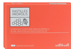
Boîte de 20 pastilles