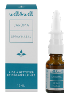
Spray de 15ml

Ingrédients : Eau osmosée, eau florale de romarin bio, sucrose laurate, glycérine, extrait hydroalcoolique de propolis, eau de mer atomisée désodée, alcool, gomme xanthane, benzoate de sodium, sorbate de potassium, huile essentielle bio de géranium, huile essentielle bio d'eucalyptus radiata, huile essentielle bio de ravintsara. Sans gaz propulseur.